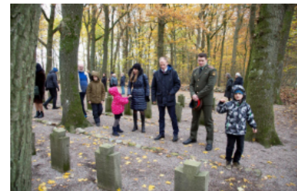
Versöhnung über den Gräbern am Kriegsgefangenenfriedhof in Lügumkloster