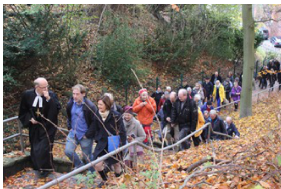
Friedensweg: Auf dem Weg zum Museumsberg in Flensburg, 2018