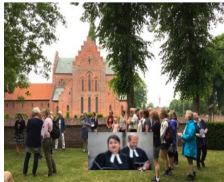
Kirchentag in Lügumkloster