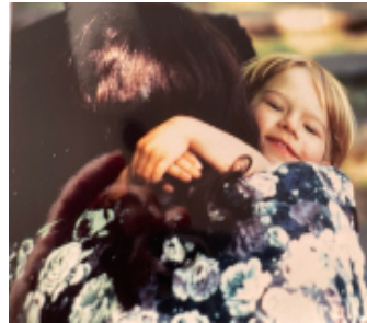
Kind umarmt Mutter