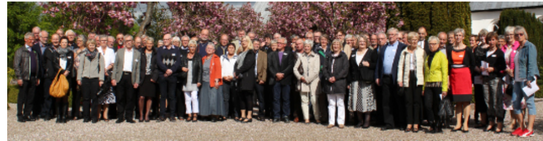
Goldene Konfirmation 2015

Der Monat April steht im Zeichen des Osterfestes und der Konfirmationen in Rapstedt und Hostrup. Am 2. Ostertag, den 10. April, lädt der Pfarrbezirk zu einem Gottesdienst mit anschließendem Osterfrühstück ins Gemeindehaus, Bülderup-Bau ein.