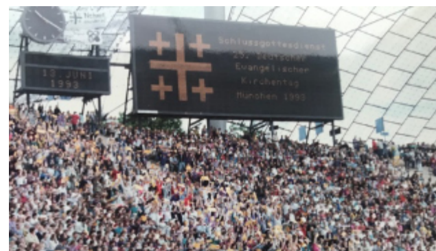
Evangelischer Kirchentag in München 1993

Mail: mail@kirche.dk ; Telefon (+45) 74 64 40 34).