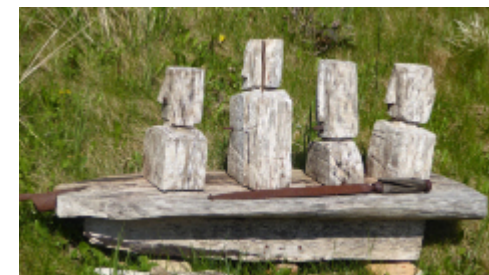
Im Boot