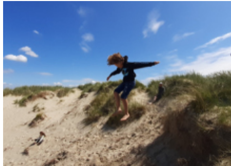
Junge in den Dünen, Römlager