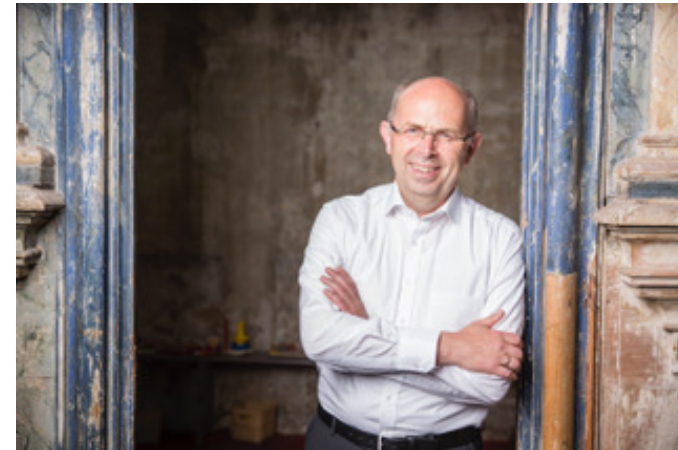
Bischof Gothart Magaard