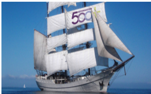
2017 legte das Schiff der Nordkirche in Sonderburg anlässlich von 500 Jahre Reformation