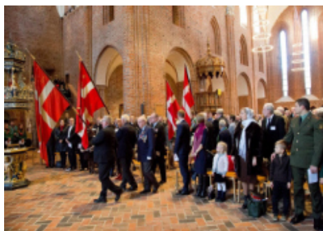
D-d Gottesdienst und Erinnerungstag zum Ende des Ersten Weltkrieges, 11.11.2018, Lügumkloster