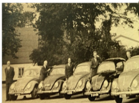
Der Fuhrpark der NG 1950