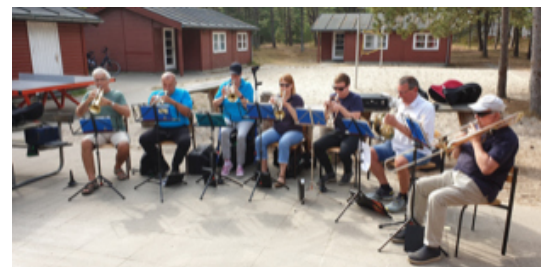
Mit nordschleswigschen Posaunenbläsern auf der Insel Röm zum alljährlichen Römlager