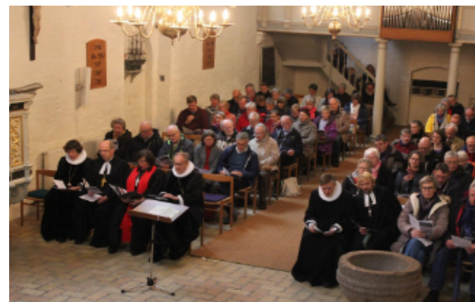
Heiliggeistkirche, Bischof Westergaard spricht zu »Versöhnter Verschiedenheit«