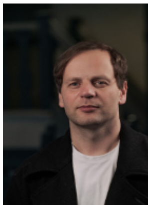
Jan Simowitsch