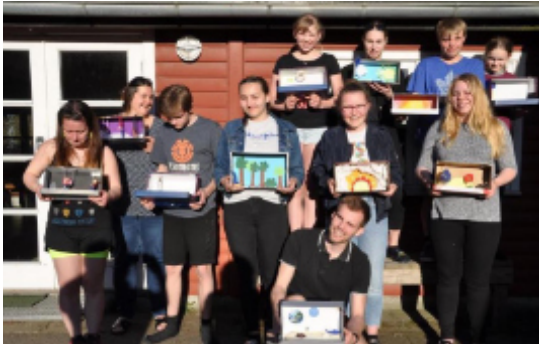
Ausbildung zur Teamercard/ Römlager