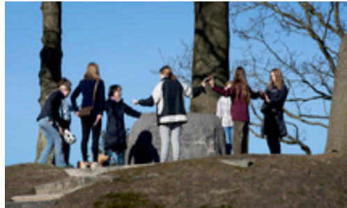
Konfirmanden in Broacker