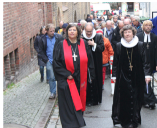
Auf dem Weg zum Frieden

In den vier Städten Apenrade/Aabenraa, Hadersleben/Haderslev, Sonderburg/Sønderborg und Tønder/Tønder wurden neben den dänischen Pastoren auch die deutschsprachigen Pastoren bei der dänischen Volkskirche (Dansk Folkekirke) angestellt. Das ist bis heute der Fall.