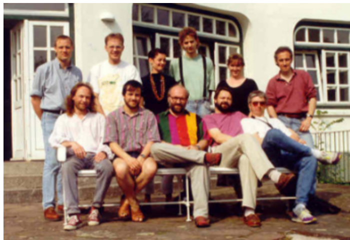
DEKTONIUM wurde auf dem Knivsberg unter der Leitung von Nis-Edwin List-Petersen gegründet