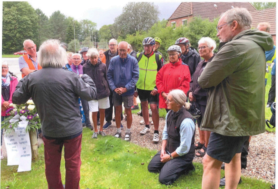
Mit dem Fahrrad zu den Pilgerstätten mit Bischoff Elob Westergaard