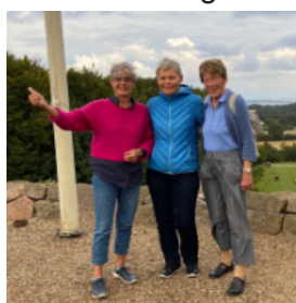
Auf dem Knivsberg

Für unseren Seelenvogel gibt es keine Grenzen von Raum und Zeit. Gern vertauscht er Gegenwart und Vergangenheit. So war seine nächste Station die