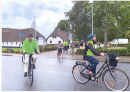
Fahrradtour mit Bischoff Magaard