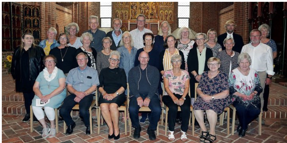
Goldene Konfirmation in Lügumkloster am 5. September 2021 Jahrgänge 1966 - 1971 aus Norderlügum und Lügumkloster

Wir stellen in unserer Gemeinde oft fest, dass viele an „ihrer“ Kirche hängen, also an der Kirche im Pfarrbezirk, der sie sich zugehörig fühlen. Auch wenn man ja eigentlich in jedem Raum (etwa in einer Scheune auf dem Bauernhof oder in einem Saal) Gottesdienst halten kann – wie wir es ja hin und wieder auch tun – so halten doch viele an der Kirche fest, in der sie getauft, konfirmiert, getraut oder ihre Goldene Hochzeit unter dem Wort Gottes halten konnten. Ein Ort, dem sie sich zugehörig fühlen in Tagen sowohl der Freude und als auch des Leides.