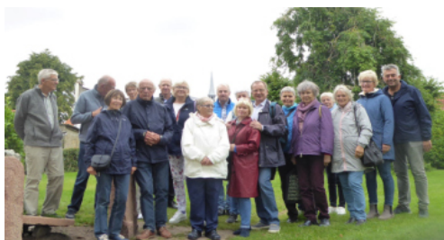
Die Chöre Lambrechtshagen und Süderwilstrup

Dann flog unser Vogel wieder südwärts. Gesang und Lachen erfüllte den Knivsberg. In den letzten Augusttagen trafen sich die Chöre aus Lambrechtshagen und Wilstrup auf dem Berg, um ihre Freundschaft zu vertiefen, gemeinsam Neues zu entdecken und einen