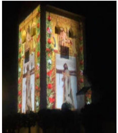
Rapstedt Kirche: Lichtprojektion

Diese Kirchen sind die Schätze in der Region, denn sie bieten den Menschen in den Dörfern Identitätspunkte an. Freud und Leid wird in den Kirchen geteilt. Hier trifft man sich zu Familienfesten, Taufen, Hochzeiten und Jubiläen. Hier wird Abschied genommen, und es werden Trauerfeiern begangen, oft mit vielen Menschen. Das ist alte dörfliche Tradition und zeigt, dass man teilnimmt am Leben und Sterben der Menschen in der Gemeinschaft.